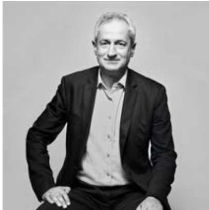
Luc Rodesch Banque privée, Entreprises & Entrepreneurs, Fiscal, Marketing, Communication & Experience