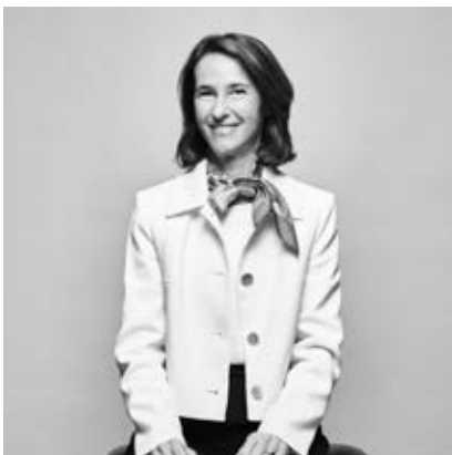
Florence Winfield-Pilotaz Asset Servicing